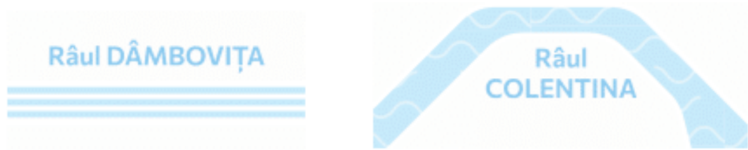
Fig. 11: Propunerea autorului pentru reprezentarea elementelor hidrografice.

Propunem simplificarea reprezentării elementelor hidrografice, prin folosirea unei singure nuanțe „faded” de bleu, fără linii paralele și fără valuri, pentru a reduce la minimum impactul vizual. De asemenea, propunem ca denumirile elementelor hidrografice să nu fie scrise cu majuscule, din același motiv anterior menționat.