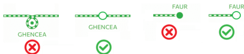
Fig. 6: Mod de reprezentare simplificată a capetelor liniilor de tramvai.