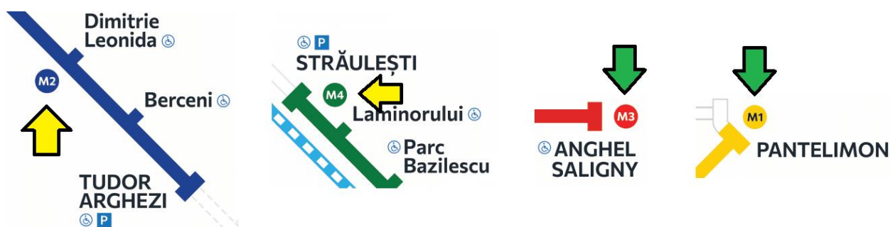
Fig. 5: Simbolurile magistrelor de metrou amplasate neintuitiv (stânga) vs amplasate intuitiv (dreapta).