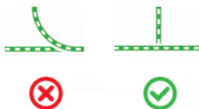
Fig. 7: Mod de reprezentare simplificată a intersecțiilor liniilor de tramvai.