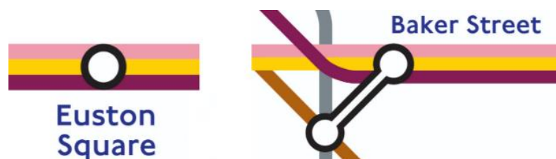
Fig. 2: Simboluri propuse pentru stații – structură simplificată de livrare a informației.

Soluție propusă: păstrând actualul model al Metrorex (la rândul său inspirat din modelul londonez), propunem simplificarea marcării stațiilor, utilizând doar 2 simboluri: stație cu / fără corespondență cu alte magistrale de metrou, la același peron (o) și stație de corespondență cu alte magistrale de metrou, cu transbordare (o=o). Această abordare simplificată de a livra informația ușurează parcurgerea hărții, fără a omite informația esențială.