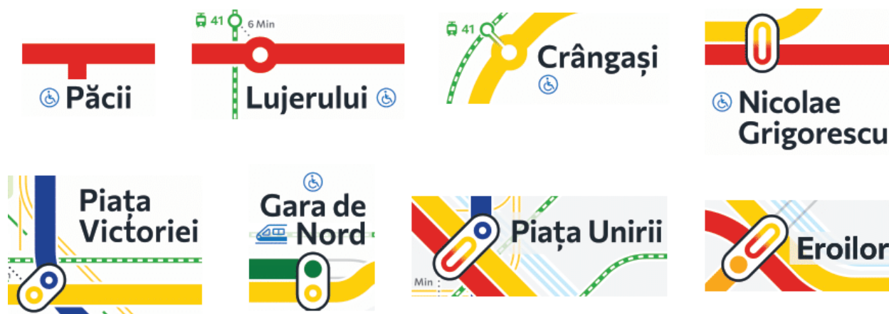
Fig. 1: Simboluri actuale pentru stații – structură excesiv de complexă de livrare a informației.

Aceste elemente sunt prea detaliate și sunt dificil de interpretat pentru publicul larg, mai ales în contextul în care aceste elemente vor apărea extrem de mici în momentul printării. Pentru publicul larg nu are importanță că stația are corespondență cu stația terminus, fiind importantă doar posibilitatea realizării transbordării.