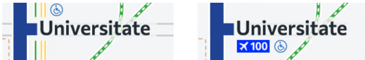
Fig. 9: Propunerea autorului pentru reprezentarea autobuzului de aeroport și a autobuzului turistic (stânga), propunerea „Metrou Ușor” pentru reprezentarea simplificată a elementelor de interes (dreapta).