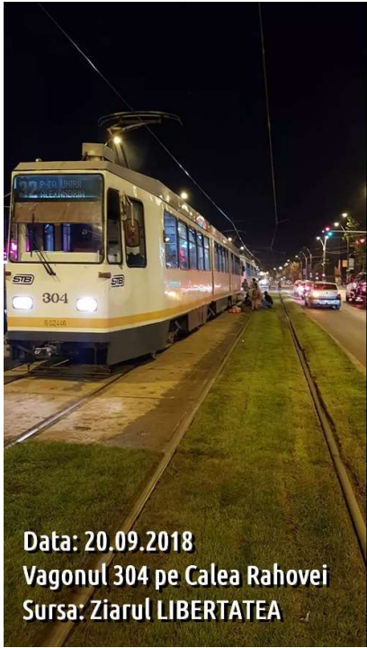
Data: 20.09.2018 Vagonul 304 pe Calea Rahovei