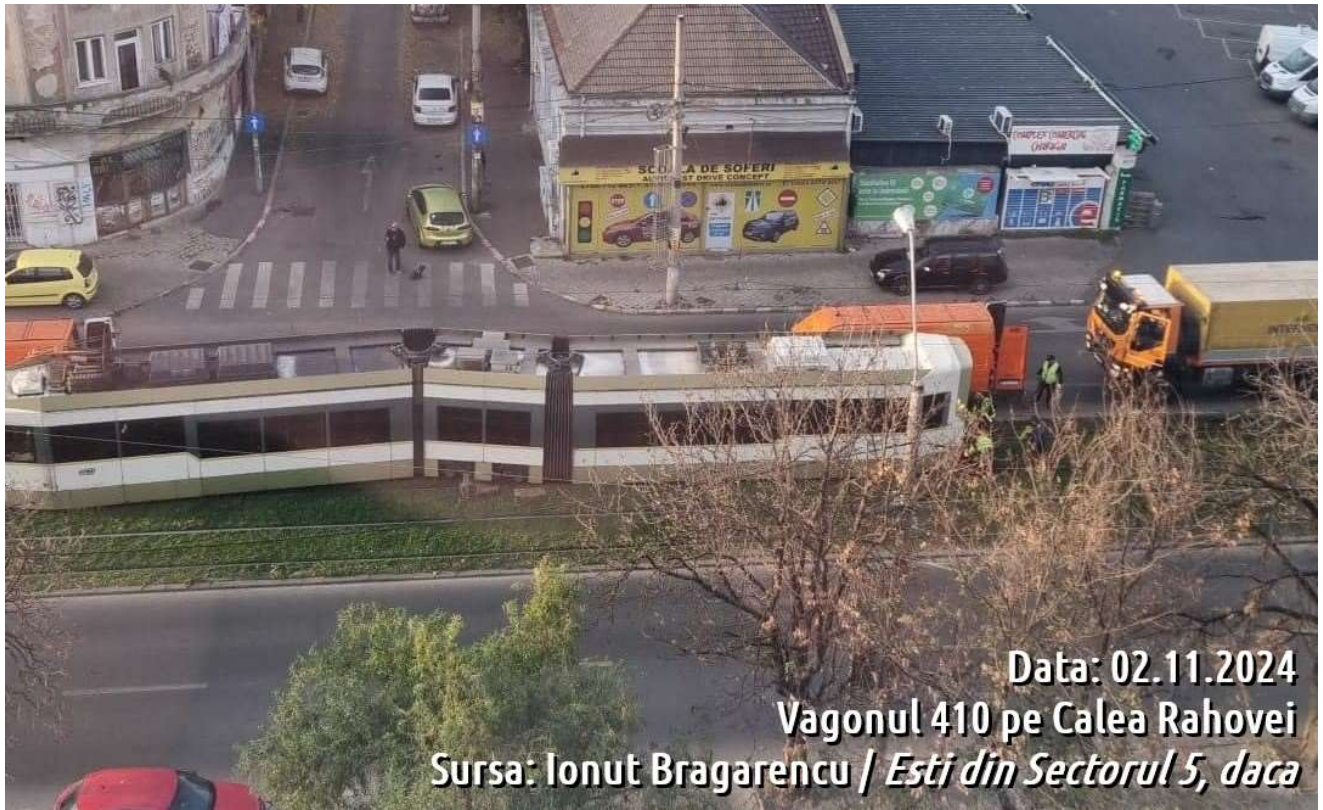
Data: 02.11.2024 Vagonul 410 pe Calea Rahovei