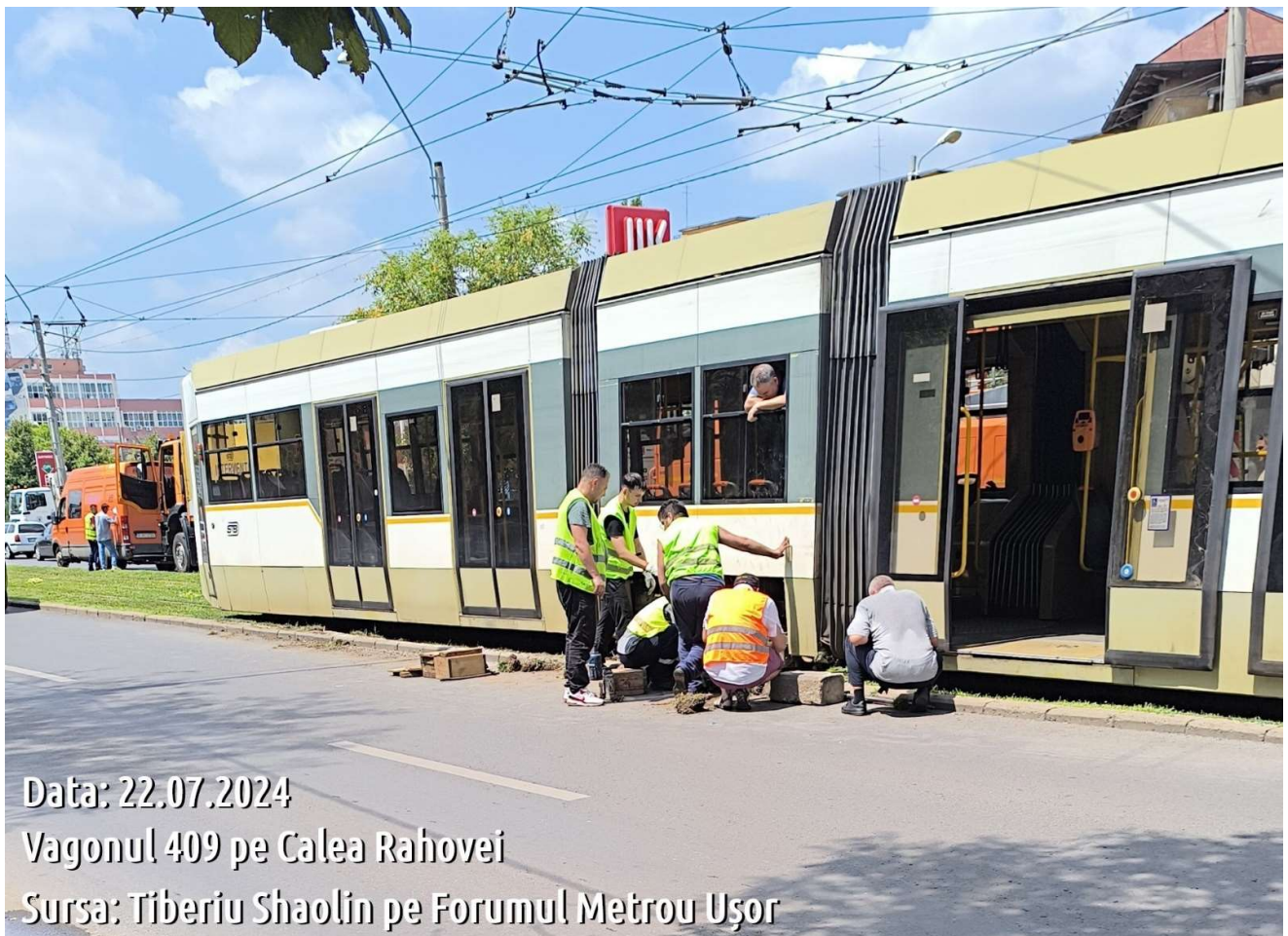
Data: 22.07.2024 Vagonul 409 pe Calea Rahovei