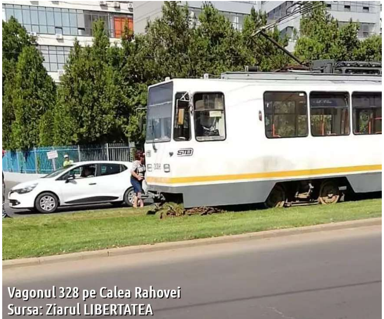
Vagonul 328 pe Calea Rahovei