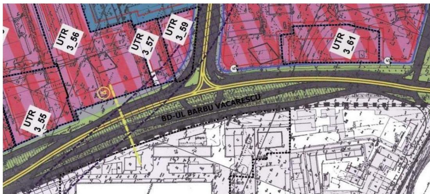
planșă de detaliu privind conectarea liniilor de tramvai de pe Bd. D. Pompeiu cu Str. B. Văcărescu.