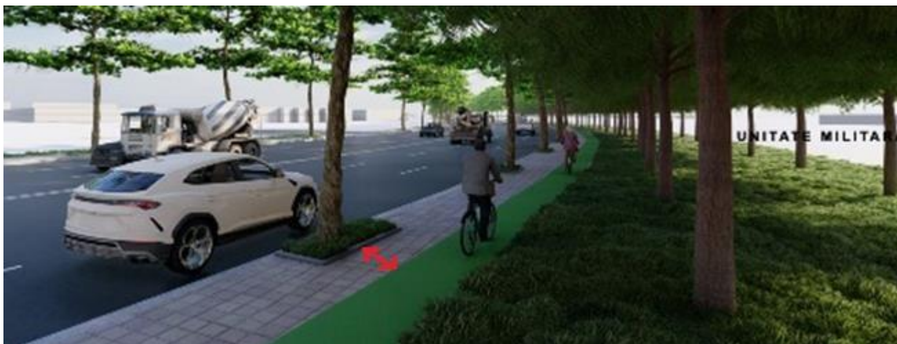
Fig. 3: Randare 3D publicată în octombrie 2021. Se remarcă trotuarul subdimensionat în dreptul alveolelor pentru copaci, precum și pista de biciclete amplasată necorespunzător pe trotuar.