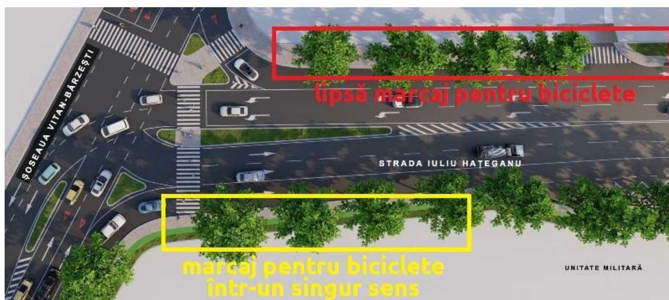
Fig. 4: Randare 3D publicată în octombrie 2021. Se remarcă proiectarea deficitară a pistelor de biciclete