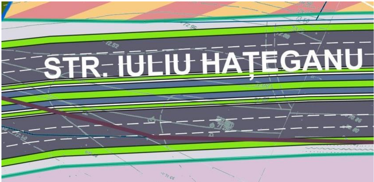
Fig. 1: Extras din P.U.Z. Zona de Sud a Sectorului 4, în care se remarcă viitoarea linie de tramvai, delimitată, de pe Str. Iuliu Hașeganu, Șos. Vitan-Bârzești și Str. Ion Iriceanu. Se remarcă cele 3 benzi carosabile distincte pe fiecare sens de circulație.