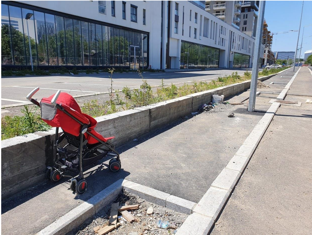
Anexa 2.1: cărucior simplu pentru copii raportat la lățimea construită a trotuarului. Notă: scaunele rulante pentru persoanele cu dizabilități locomotorii sunt mai late.