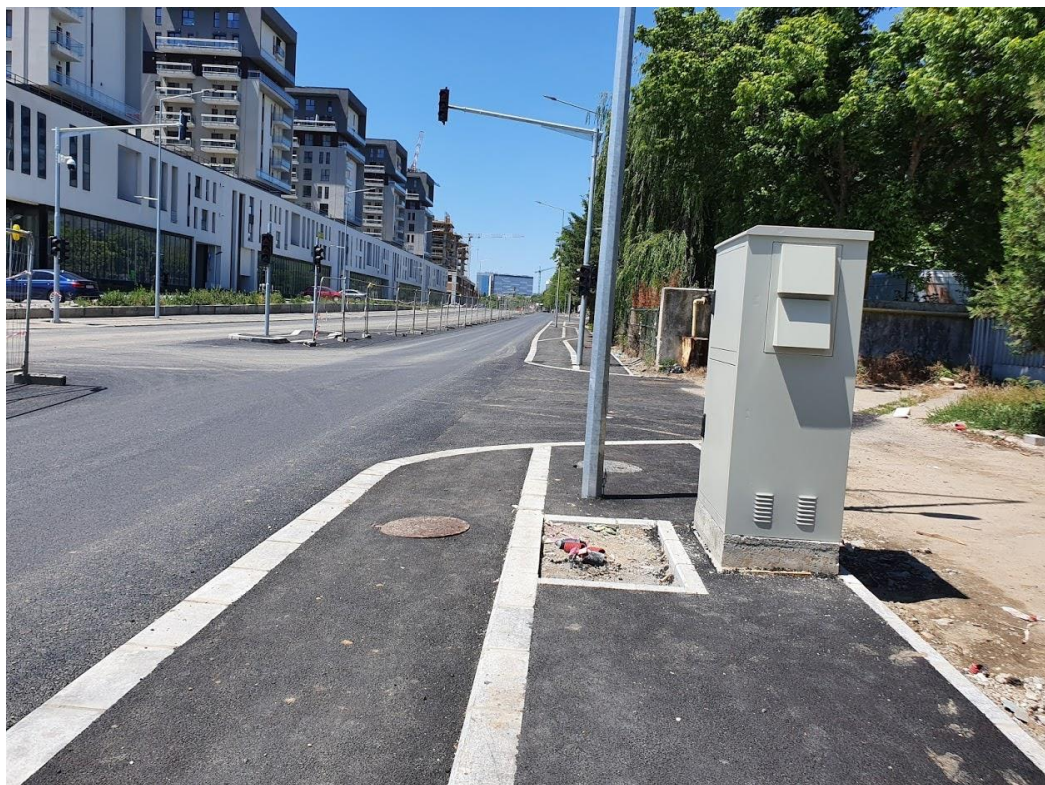
Anexa 2.2: dulap tehnologic, alveolă și stâlp de iluminat care obstrucționează complet trotuarul. Spațiul pietonal dispare în totalitate. Pietonii vor circula pe pista de biciclete, fapt ce constă în un pericol pentru ambele categorii de participanți la trafic.