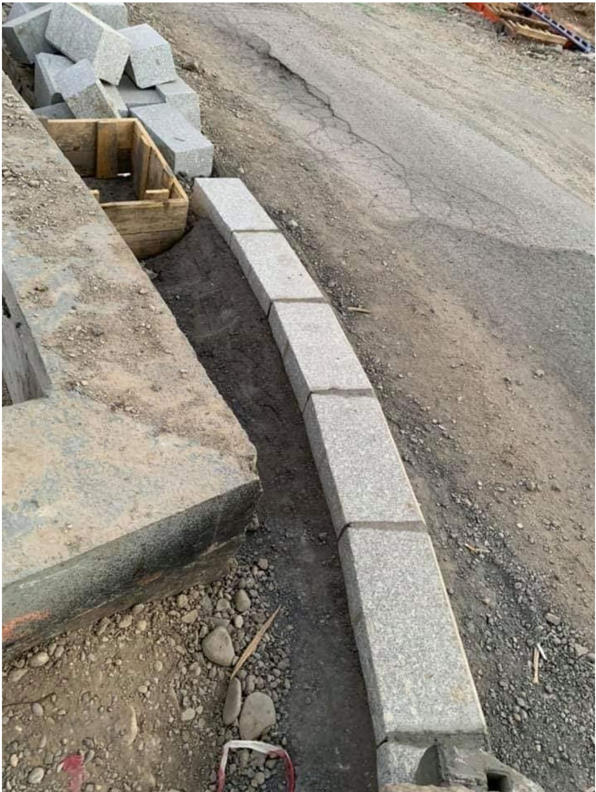
Anexa 1.2: intersecția Șos. Fabrica de Glucoză - Intrarea Chefalului