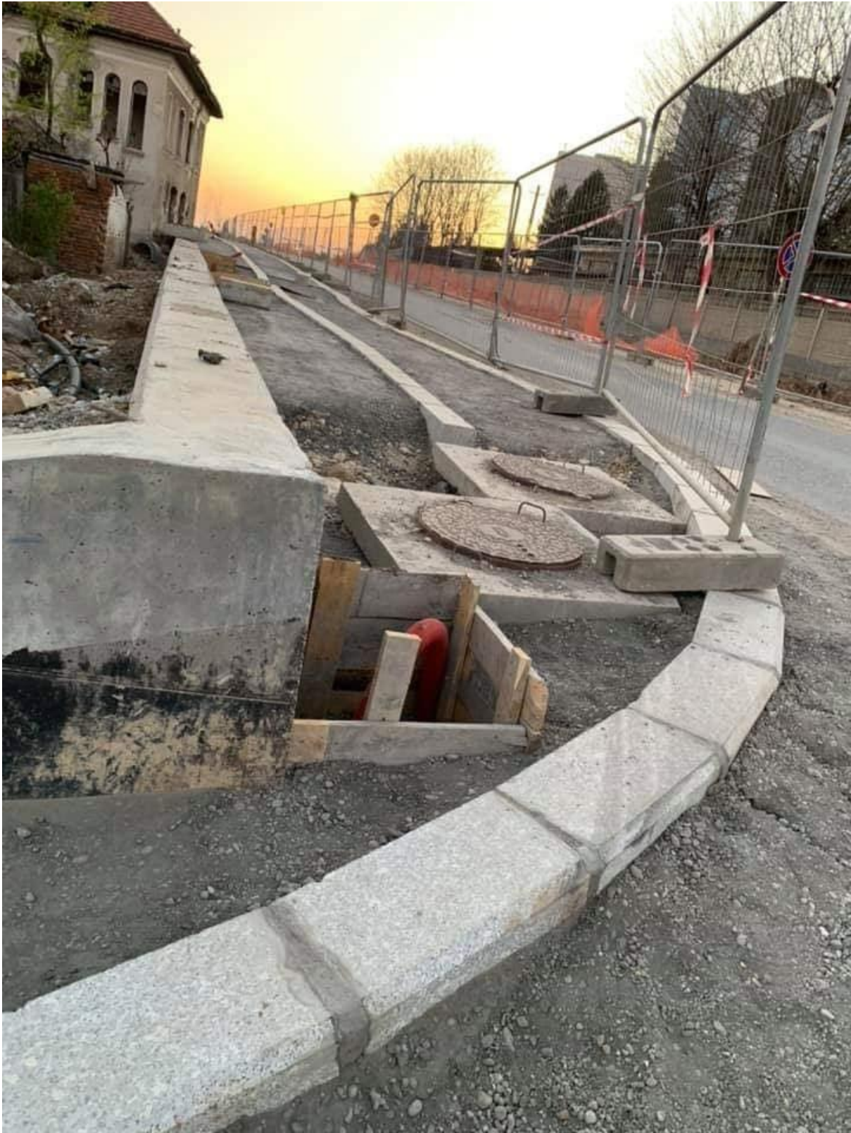
Anexa 1.1: intersecția Șos. Fabrica de Glucoză - Intrarea Chefalului