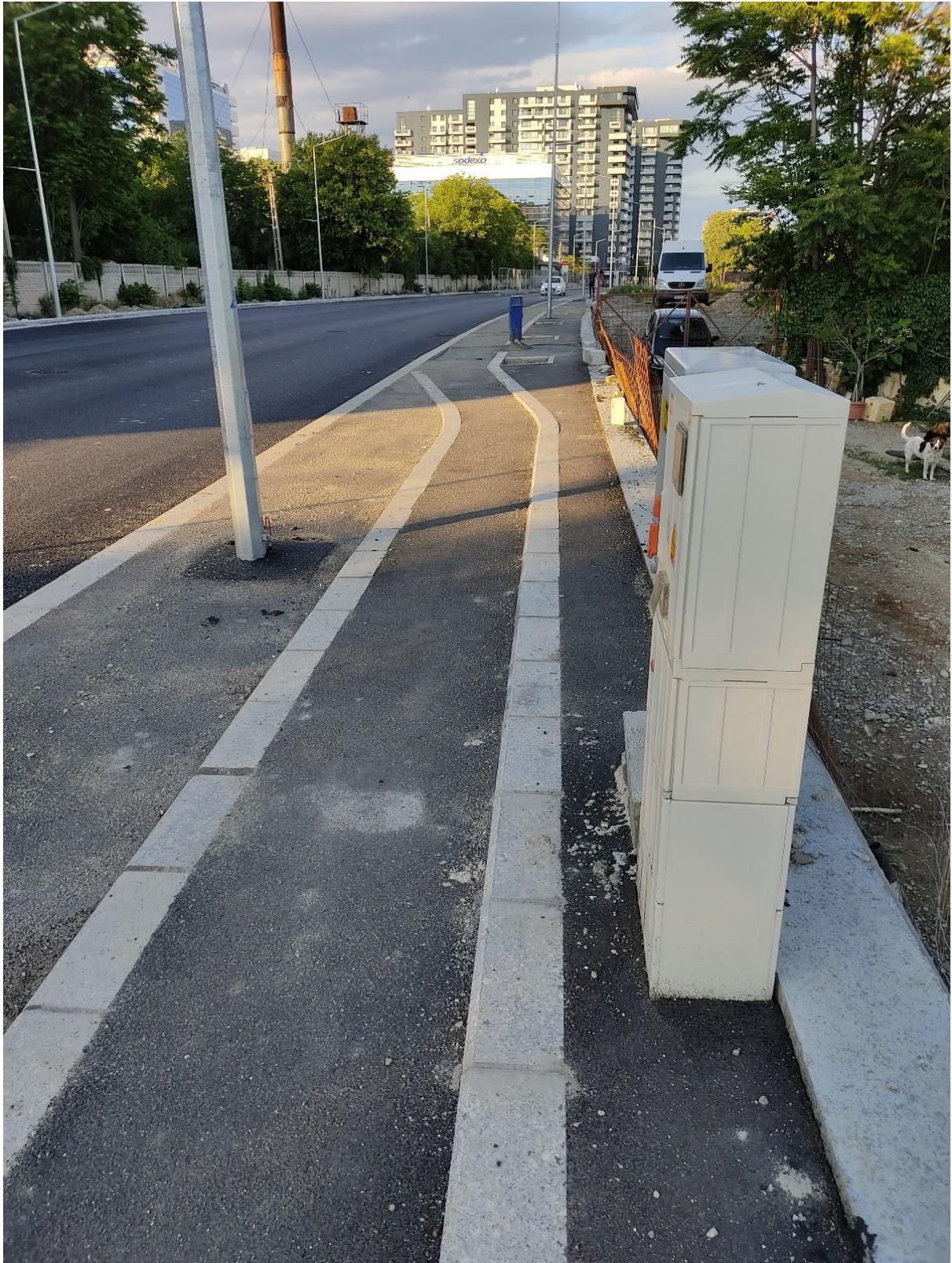
Anexa 2.3: dulap tehnologic pentru utilități care obstrucționează în totalitate trotuarul.