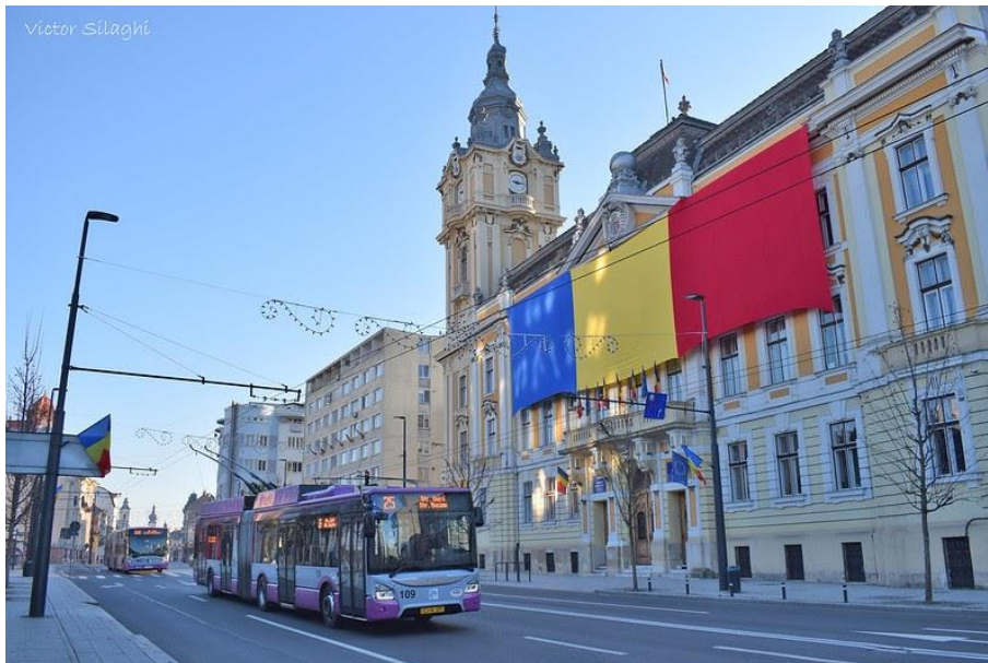
Troleibuze moderne din Cluj-Napoca.